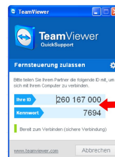
Diese Zugangsdaten benötigen wir dann telefonisch von Ihnen

➔ Kurz vor Beginn unseres Supports tun Sie bitte Folgendes: