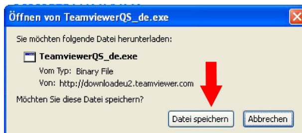
Download der Teamviewer Software von der Webseite des Anbieters

Laden Sie kostenlos den TeamViewer QuickSupport herunter und starten das Modul. TeamViewer benötigt keine weitere Installation!