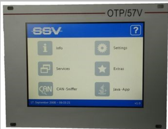
Bilder zeigen Beispiele. Änderungen vorbehalten.

Panel PC zum selbst Programmieren. Zum Einbau in 19“ Gehäuse, mit 5,7“ VGA Display, Farbe, Touch Screen und vielfältigen Schnittstellen (Netzwerk, Seriell, CAN...). Linux und Java vorinstalliert – extrem minimale Abmessungen!